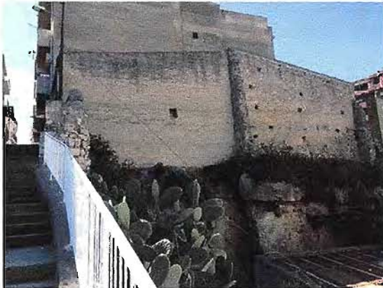
Scala di collegamento via Pirrello zona D1.2

L'accesso alla zona D1.2 oggi è possibile solo attraverso l'utilizzo di una scala di collegamento con esclusivo accesso dalla via Pirrello, in quanto dalla via Ten. Mannina l'accesso è precluso, pertanto la realizzazione della previsione viaria consentirebbe l'accesso a detta scala anche dalla via Ten. Mannina.