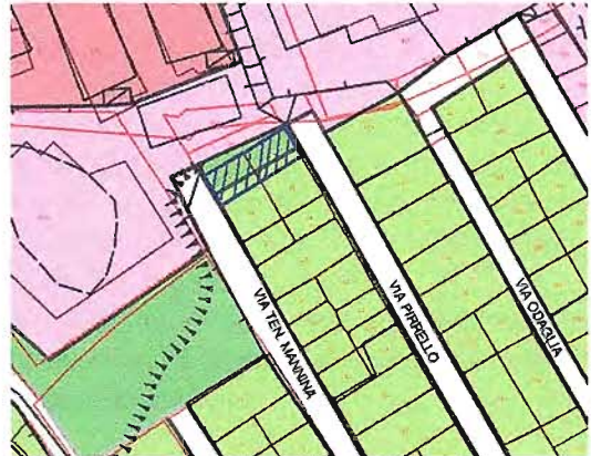
foglio di mappa n. 41 part.lla n. 23 e n. 24