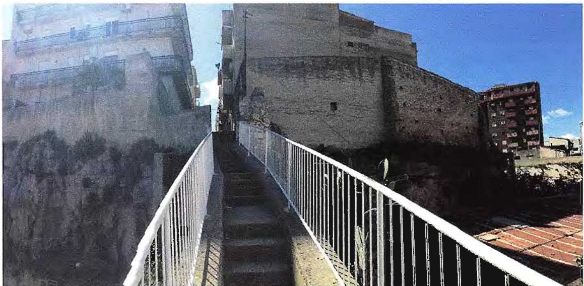
Vista dell'area, da Nord (fabbricati posti a destra della sommità della scala).